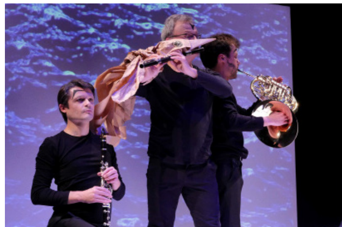
«Musiques de papier» de Raphaèle Biston a bénéficié d'une aide à l'écriture d'une oeuvre musicale originale du Ministère de la Culture.

L'aile, en déploiement ou en vol, attise l'imaginaire du corps : entre position symbolique de l'instrument figé et mouvements de bras évocateurs. Les musiciens font vivre une marionnette de papier de sa conception à son envol. Véritables acteurs scéniques, ils développent une complicité forte avec l'oiseau.